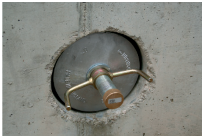
Aqua Stopper als Verschluss von Kernbohrungen